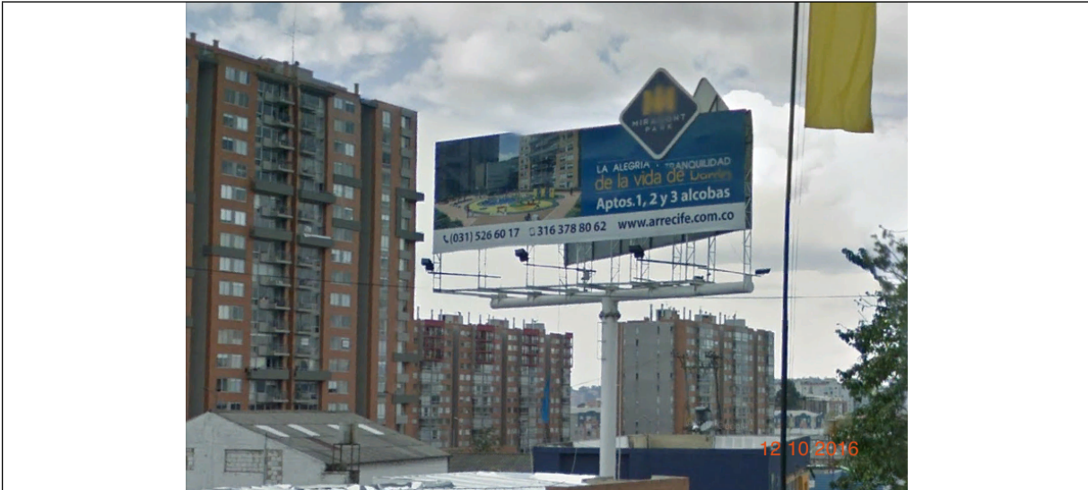
Fotografía no. 4 vista de la publicidad de la valla instalada en la Carrera 8 No. 167D - 88 sentido Este - Oeste, la cual no cuenta con Resolución de otorgamiento.