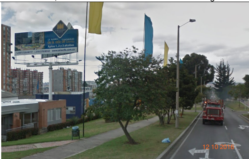
Fotografía no. 3 vista panorámica elemento instalado en la Carrera 8 No. 167D - 88 sentido Este - Oeste, el cual no cuenta con Resolución de otorgamiento.