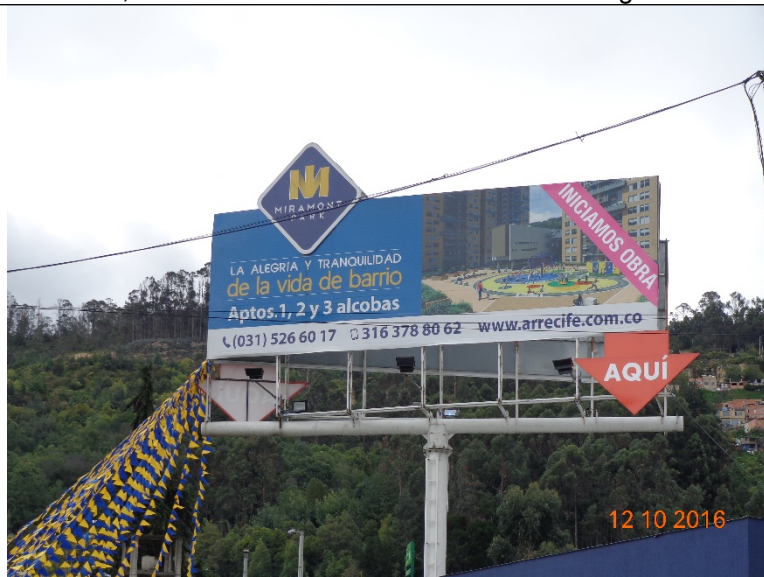
Fotografía no. 2 vista de la publicidad de la valla instalada en la Carrera 8 No. 167D - 88 sentido Oeste – Este, la cual no cuenta con Resolución de otorgamiento.